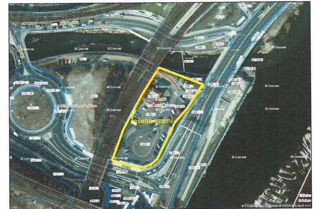
Situační výkres širších vztahů M 1:2000

D – drážní kilometr železniční trati (staničení) 516.7